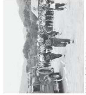
消防ポンプ甲斐法大会の様子