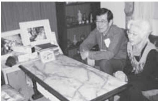
⑤訪問安否確認事業