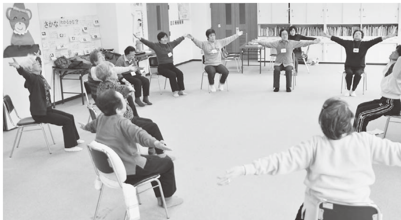
〈つよい足腰を作ろう会〉参加風景

元気であることは日々の暮らしを楽しむためのとても大きな要素です。介護が必要な状態では、気ままに趣味を楽しむことも難しくなるでしょう。30年、40年と仕事に打ち込み、子育てに追われ、やっと手にした自分だけの時間。自分の好きなように旅行に出掛け、好きな物を食べ、趣味に打ち込む。こんな理想のセカンドライフこそが、人生の後半にはふさわしいはず。 「楽しい日々を過ごせたいのはもったいない。」この気持ちを持って、あなたも今日から介護予防に取り組んでみませんか。