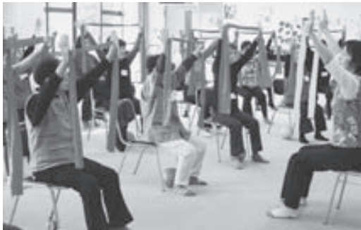
③サウンドセラビクス