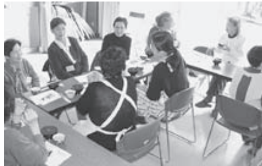
②ふれあいいいききサロン