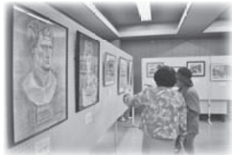
写真は昨年 の公サ連まつりの ようす