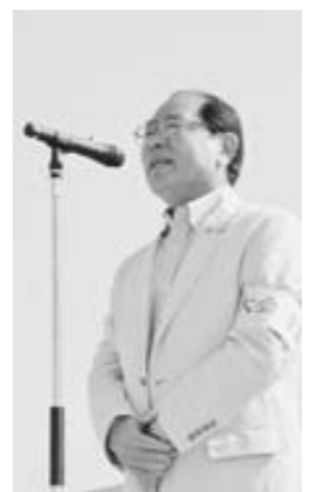
雨の降った後には、気持ちのいい青空が広がり、正に空の洗濯と言った風情です

▼9月15日/大山崎中学校校体育大会▼22日/町議会本会議(閉会)▼24日/仲秋の名月観賞会▼28日/町内会・自治会運営交流会(10月12日まで)▼29日/乙老協グラウンドゴルフ大会▼10月2日/知事との和いらいミーティング▼6日/乙老協ゲートボール大会▼9日/第50回町民体育祭