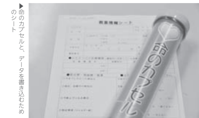
▶命のカプセルと、データを書き込むためのシート

対象者 ①65歳以上の一人暮らしの方、および65歳以上の高齢者世帯の方 ②障害児者 ③健康に不安を抱えている方 ※①の方には、11月中旬以降に担当地域の民生児童委員が訪問し、配布します ※②③の方で配布を希望される場合は、福祉課にご連絡ください 問 福祉課社会福祉係 ☎956-2101(内151)