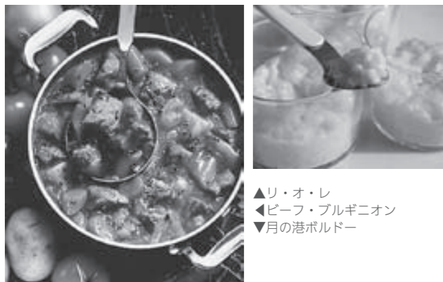
▲リ・オ・レ ▲ビーフ・ブルギニオン ▼月の港ボルドー