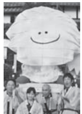
▶当日は「エゴマちゃんねぶた」も登場します！

第26回国民文化祭・京都2011の大山崎会場のひとつである離宮八幡宮で、エゴマカフェとせっけん作りに加え、ポプリ作り体験ワークショップを開催します。 温かいエゴマ茶とスイーツでほっと一息入れたい方も、オリジナルグッズを作りたい方も、ぜひお越しください。 ポプリ・せっけん作り エゴマの葉や穂のポプリに加え、手作りハーブをブレンドします。あなただけのオリジナルブレンドができます。せっけん作りとセットでの参加となります。 とき 11月5日(日) 午後1時～4時頃 ところ 離宮八幡宮境内 対象 11歳以上(小学生以下は保護者同伴) 定員 20組(先着順) 参加費 1人200円