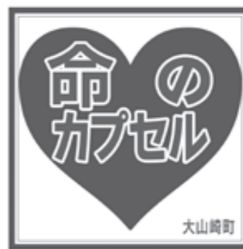
▶冷蔵庫に貼るマグネットシール

「命のカプセル」とは、急病時などに備えて、冷蔵庫に保管しておく医療情報の入った容器のことです。もしものときは、救急隊員が命のカプセルに保管されている情報に基づき、適切な医療機関に搬送。的確な救命措置に役立てるための取り組みです。