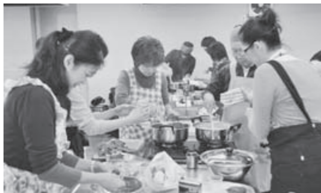
▲昨年のイタリアフェスタのときの料理風景

定員11 30人(先着順) 参加費11 500円 持物11 ▼エプロン ▼ふきん ▼タオル ▼タッパー 申込方法11 11月25日(金)までに電話で▼住所▼氏名▼電話番号を左記まで。 主催11 大山崎町、大山崎町国際交流協会 問・申込先11 総務課秘書広報係 ☎956-2101(内312)