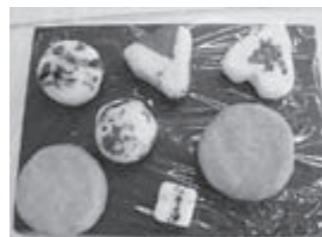
▲エゴマせっけん いろいろな形のものを作れます

第26回国民文化祭・京都2011の大山崎会場のひとつである離宮八幡宮で、エゴマカフェとせっけん作りに加え、ポプリ作り体験ワークショップを開催します。 温かいエゴマ茶とスイーツでほっと一息入れたい方も、オリジナルグッズを作りたい方も、ぜひお越しください。 ポプリ・せっけん作り エゴマの葉や穂のポプリに加え、手作りハーブをブレンドします。あなただけのオリジナルブレンドができます。せっけん作りとセットでの参加となります。 とき 11月5日(日) 午後1時～4時頃 ところ 離宮八幡宮境内 対象 11歳以上(小学生以下は保護者同伴) 定員 20組(先着順) 参加費 1人200円