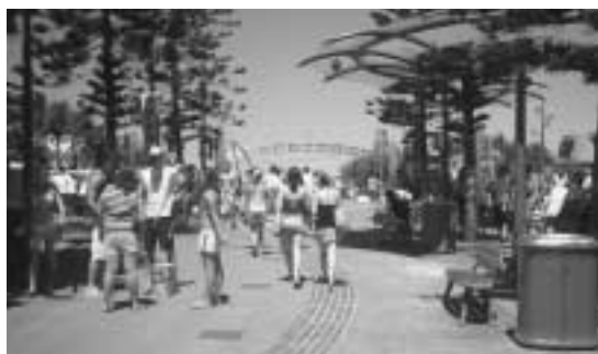
「スクーリース・ウィーク」期間中のサーファーズパラダイス