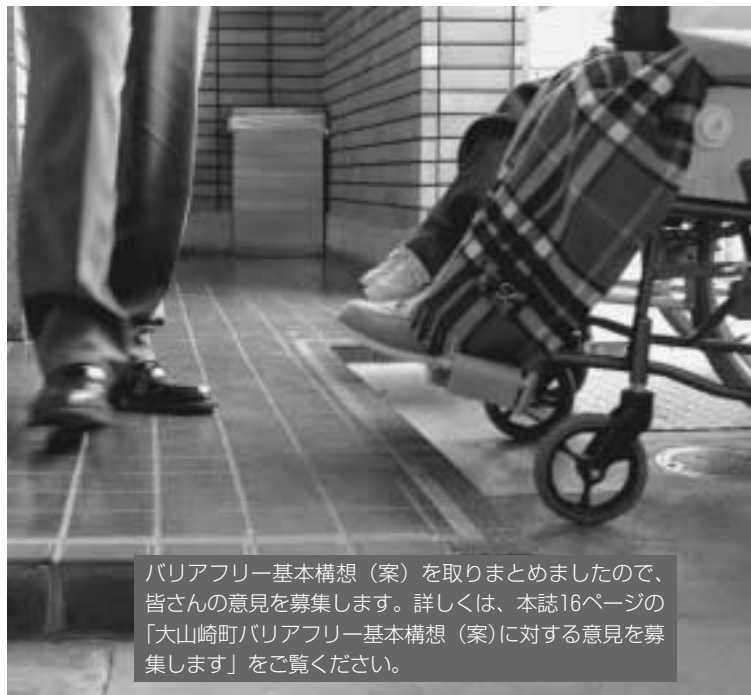
バリアフリー基本構想（案）を取りまとめましたので、皆さんの意見を募集します。詳しくは、本誌16ページの「大山崎町バリアフリー基本構想（案）に対する意見を募集します」をご覧ください。

タウンウォッチング終了後に行ったワークショップでは、どの箇所が問題で、どのように改善するのが望ましいのか、といった意見交換が活発に行われ、班毎に意見が取りまとめられました。