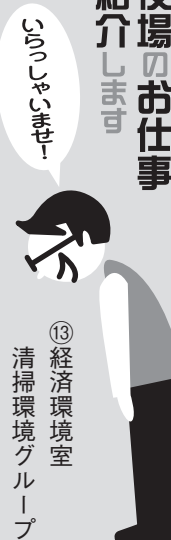
③ 経済環境室 清掃環境グループ