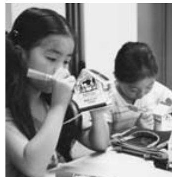
身近な科学遊び教室「メロディハウスを作ろう」