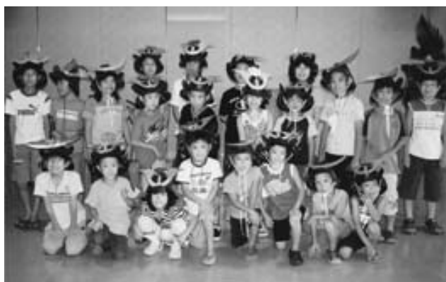
夏休み子ども歴史教室「武将のかぶと・よろいをつくろう!」