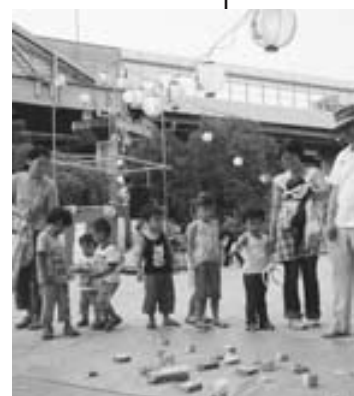
輪投げコーナーで遊ぶ子どもたちの元気な声も盆踊り大会を盛り上げていました