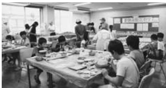
夏休み子ども陶芸教室