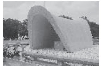
（上）広島平和記念公園内の原爆死没者慰霊碑（中）町民代表の3人によって奉納された折鶴（下）会場は、全国から集まった多くの人で埋めつくされました