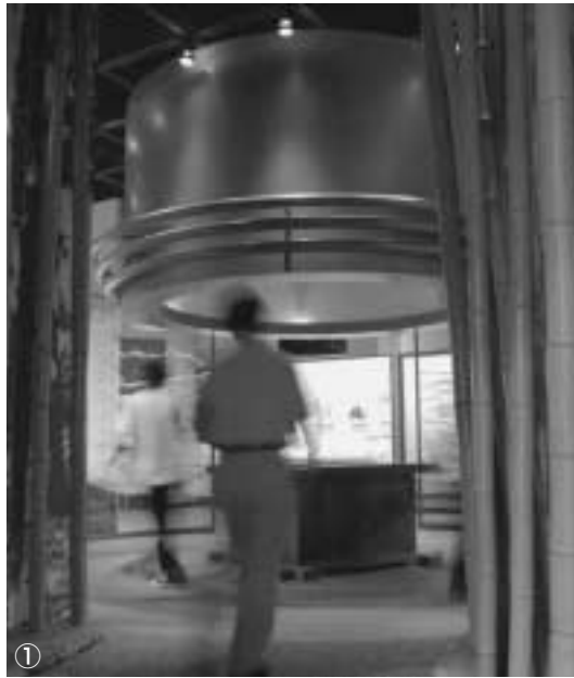
①資料館入り口の「竹の小径」 ②国宝の茶室「待庵」の原寸大模型 ③江戸時代の大山崎の様子を描いた山崎通分間延絵図（複製） ④大山崎遺跡群内の発掘調査で出土した軒瓦など ⑤9世紀後半の山崎津周辺の復元模型

自分が住んでいる町のこと、あなたはどれだけ知っていますか？ ここに来れば、大山崎町のことをもっと好きになれるかもしれません。「天王山・淀川 歴史と文化 うるおいのあるまち」に秘められた深い歴史を勉強してみては？