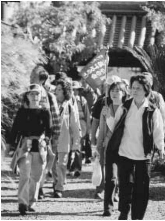
旗を手に、先頭を歩いてお客さんをガイドします。

れだけ文化財や歴史的名所も近くに集中しているんです。良い意味で小ぢんまりとまとまっているんですよ。車で電車を降りて、そのまま徒歩だけで見て回ることもできる。これは、他の市町村にはあまり見られない特色だと思いますよ。」