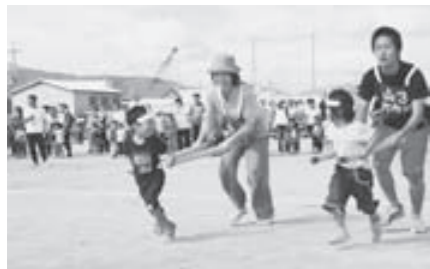
※昨年の町民体育祭「電車でGO！」のようす