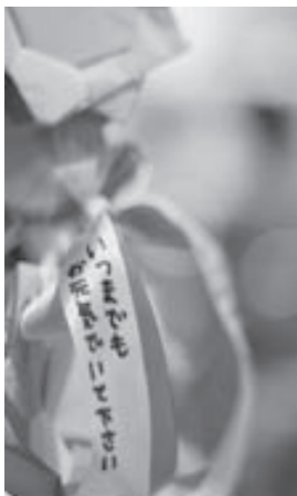
敬老会では、保育所の子どもたちが花の首飾りなどを作ってくれました