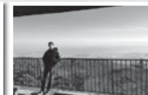
エッシネンゼーと六甲山

※今月は議会だよりにもスイス通信を掲載していますので、そちらもぜひご覧ください!