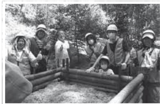
▲竹の柵、竹チップでカブトムシの寝床完成

4月28日、KDDI(株)の社員とその家族を含む119人が、天王山山頂近くの酒解神社境内林で第24回森林保全ボランティア活動を実施しました。