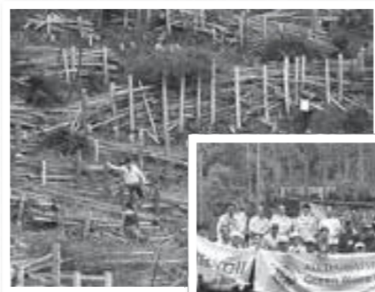
▲一帯の竹林をバッサリ

また、ボランティア団体、大山崎竹林ボランティアの協力で、伐採竹を使って、竹箸や竹トンボなど、竹細工作り体験や、新生竹間引きのため筍掘りをしました。