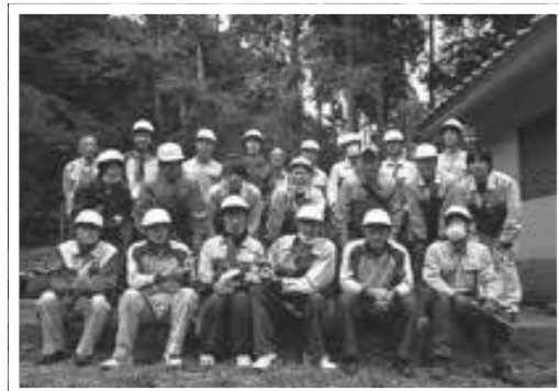
▲ダイハツ工業のみなさん

この活動は、放置竹林を整備して広葉樹林に導き、地下水の涵養機能を高めるために、平成25年度から実施されています。参加者は天王山が美しい里山になるよう願