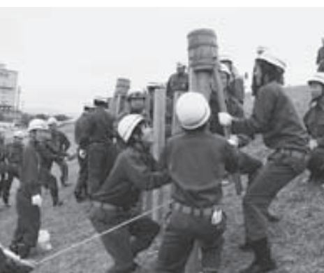
きびきびとした動きで訓練に取り組む消防団員

この訓練は、住民の生命と財産を守るため、水防技術のレベルアップを目的に毎年実施しているもので、基本の「土のう作り」から、河川のはんらんや堤防の崩壊を食い止める「杭打ち積土のう工」、「月の輪工」を行いました。