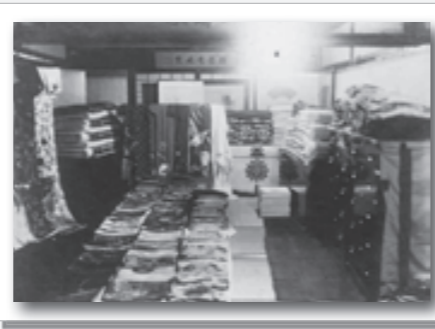
▲(写真2) 家の中で嫁入り道具をお披露目(明治末期頃)