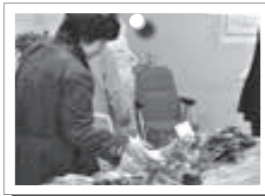
▲農林フェスタ (野菜の展示即売会)