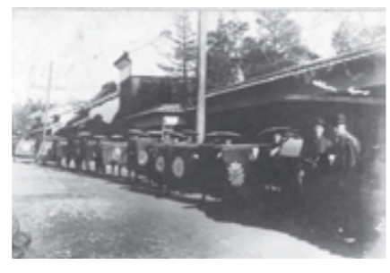
▲(写真1) 嫁ぐ前に、家の前での記念撮影(明治末期頃)

街並みもこの風習も、今はあまり見かけない珍しい光景です。