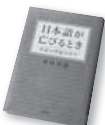
「日本語が亡びるとき」 水村 美苗／著 筑摩書房

「西洋の衝撃」を全身に浴び、豊かな近代文学を生み出した日本語が、いま「英語の世紀」の中で「亡びる」とはどういうことか？