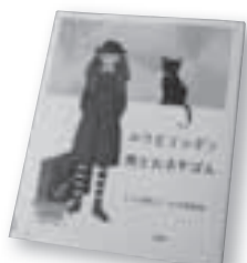
「ルウとリンデン 旅とおるすばん」 小手鞠 るい／作 北見 葉胡／絵 偕成社

「わたし、旅に出る。いい猫で、おるすばんしててね。」こう言い残して世界一周の旅に出たルウ。森でおるすばんをしているリンデンは、何をしてもルウのことが気になってしまいます。