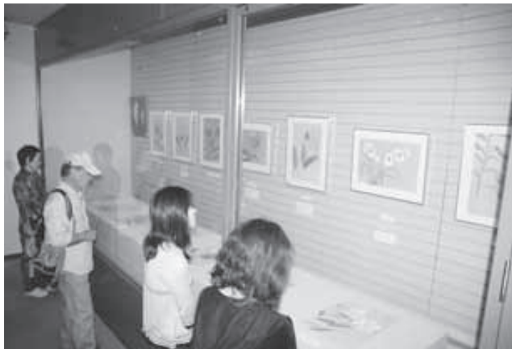
(上) 展示室で色鮮やかな原画に見入る来館者たち。 カトリアの甘い香りが漂ってきそうです