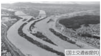
▲桂川はいつもより高水位でもおかしくない状況でした

幸い、町内では大きな被害はありませんでしたが、桂川ははん濫危険水位を超え、非常に危険な状況でした。町では今回の災害対応を検証し、今後の防災対策にいかしていきます。