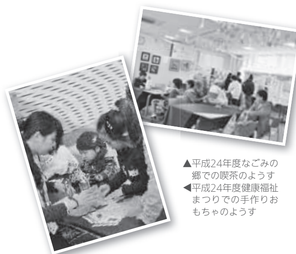
▲平成24年度なごみの郷での喫茶のようす ▲平成24年度健康福祉まつりでの手作りおもちゃのようす