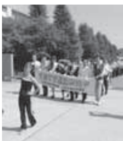
▲9月21日 日 に一日警察署長である乙訓高校の生徒とともに、秋の全国交通安全運動スタートのパレードを行いました。

最近の主なあしあと ▼9月13日／敬老会 ▼21日／秋の全国交通安全運動スタート式 ▼22日／枚林ジュニアフェンシング選手権大会 ▼10月11日／秋の防犯活動街頭啓発・乙訓消火技術競技会