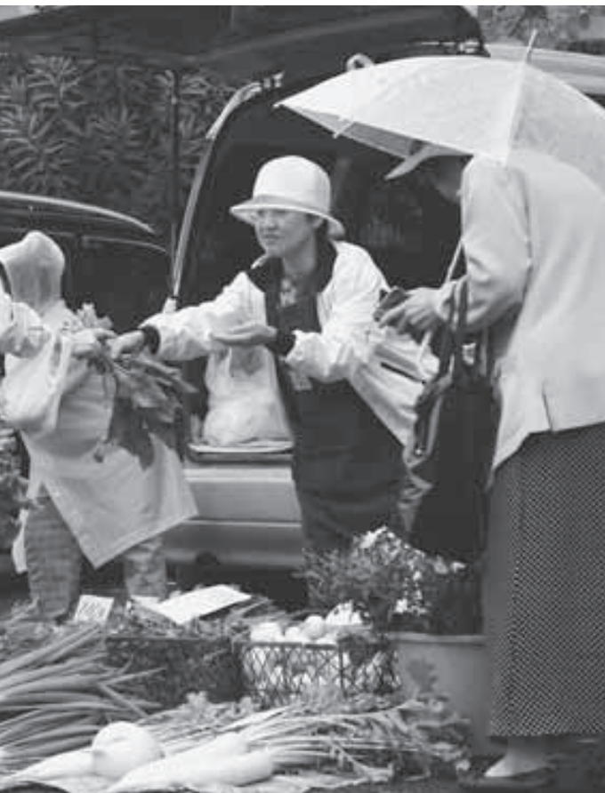
季節の旬の野菜を求めて多くのお客さんが集まります