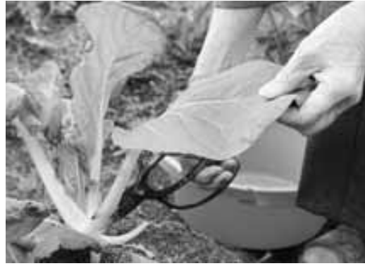
(上) 専用のはさみを使って、その日必要な分だけを収穫します (下) なんと、道具のほとんどは手作りです